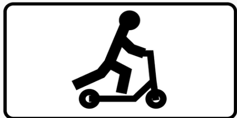
Знак 8.4.7.2 «Лица, использующие для передвижения средства индивидуальной мобильности»