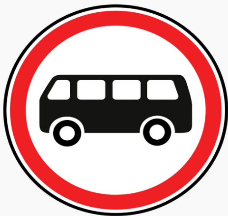
Знак 3.34 «Движение автобусов запрещено»