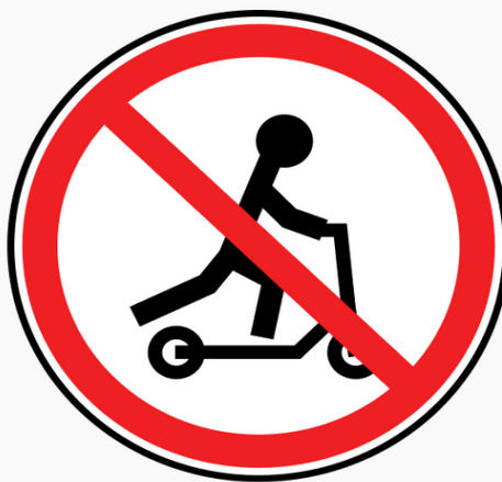
Знак 3.35 «Движение на средствах индивидуальной мобильности запрещено»